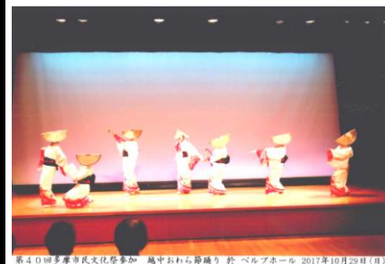
第40回多摩市民文化祭参加 越中おわら節踊り 於 ベルブホール 2017年10月29日(日)