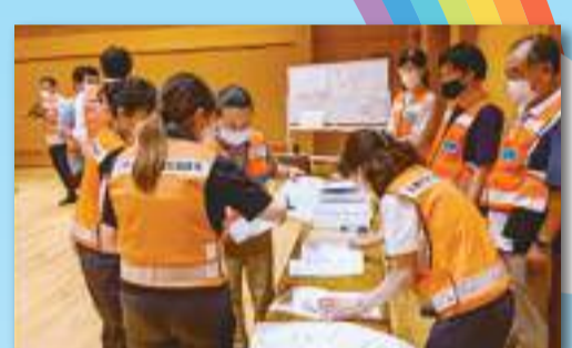
災害ボラセンの運営 ～災害時のつながり～