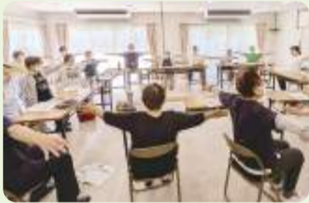
ふれあい・いきいきサロンなどの活動支援に