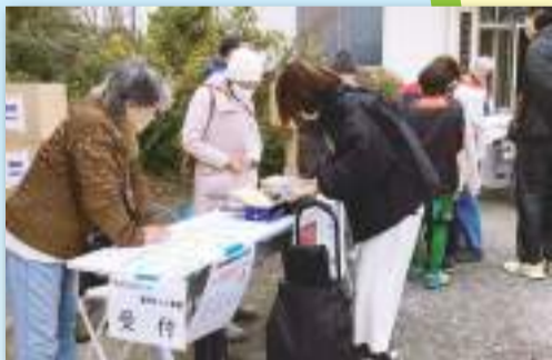
食料配布事業 ～暮らしを支えるつながり～