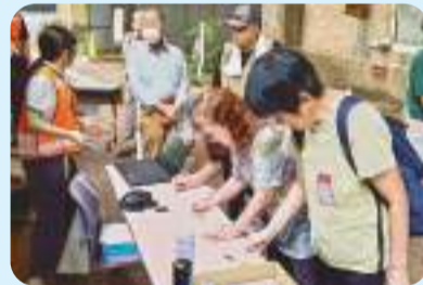
災害ボラセン設置・運営訓練