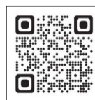
「夏のボランティア体験」詳細ページ