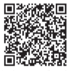
多摩テレビ紹介 72時間ゲーム

参加した生徒からは、「災害時には地域の大人と協力する必要があると思った」「隣近所にどんな人が住んでいるか気にしてみようと思った」といった声が寄せられました。地域の中で互助を考えるきっかけとなる『72時間ゲーム』、あなたも地域の団体でも取り組んでみませんか？