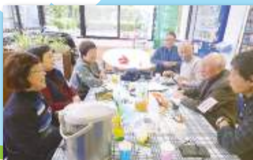
地域の居場所づくり ～ご近所のつながり～