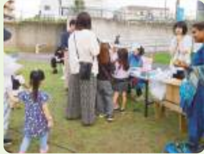
地域福祉推進委員会の活動支援に