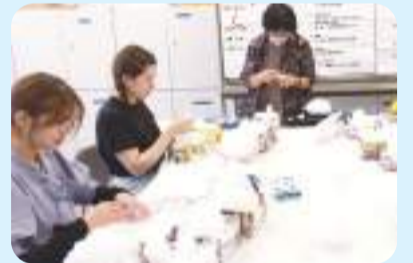
ボランティア体験・講座