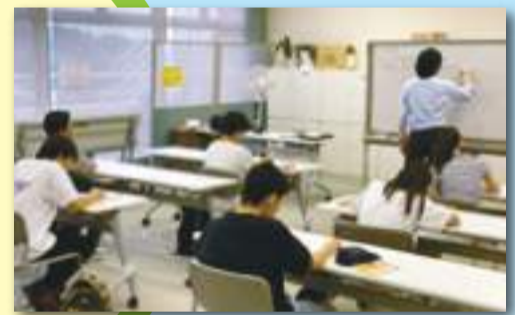
学習支援の実施 ～NPO・大学とのつながり～