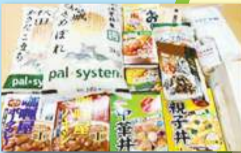
フードドライブ ～企業等とのつながり～