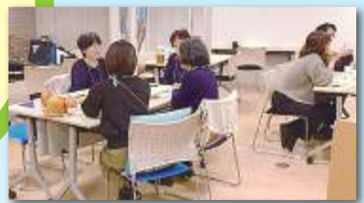
生きづらさを抱える方の居場所 スペース菜 ～ゆるやかなつながり～

この計画は、多摩市社協が、多摩市民、自治会・住宅管理組合、ボランティア・市民活動団体、社会福祉法人、企業、大学、福祉関係機関、行政など、様々な主体と相互に連携・協働して、地域の生活課題解決に取り組むための令和8年度から10年度の道筋を示したものです。