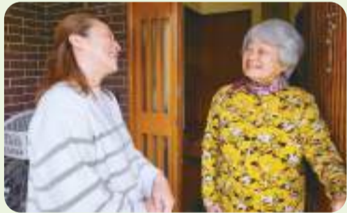
地域での見守りや支えあいの取り組み支援に