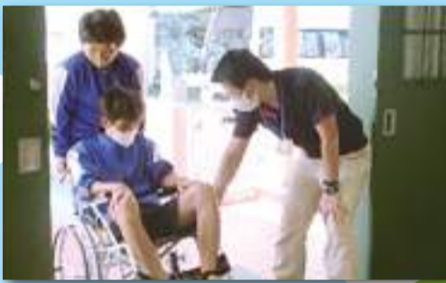
福祉体験学習 ～地域のつながり～