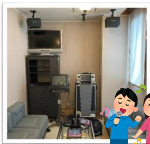
↑こちらが「音楽活動室」です♪