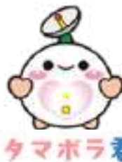
タマポラ君 多摩ボラセン マスコットキャラクター