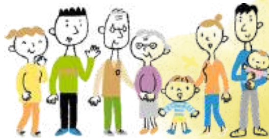
地域の中で支援が必要な人