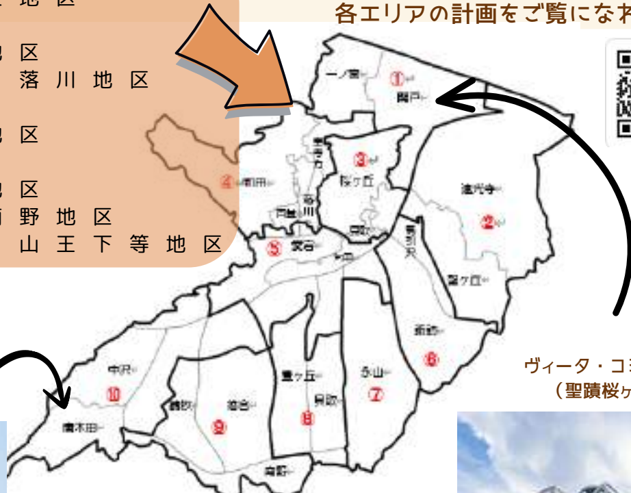
多摩市10のコミュニティエリア