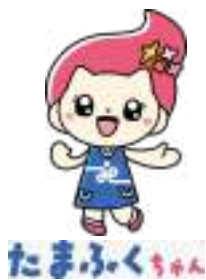
たまふくちゃん 多摩市社協の法人化 50周年記念キャラクター