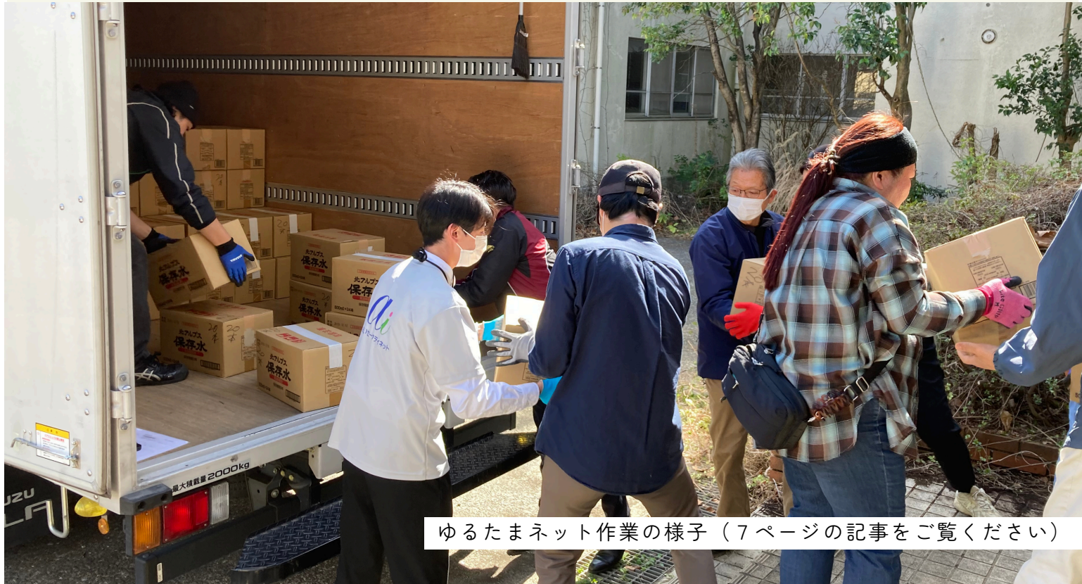
ゆるたまネット作業の様子（7ページの記事をご覧ください）