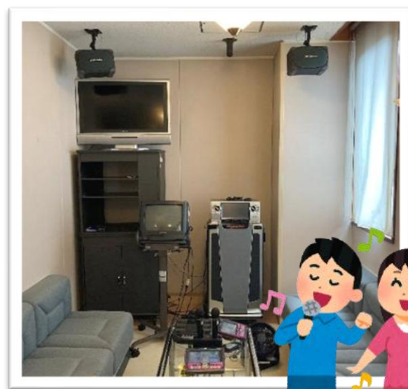
↑こちらが「音楽活動室」です♪