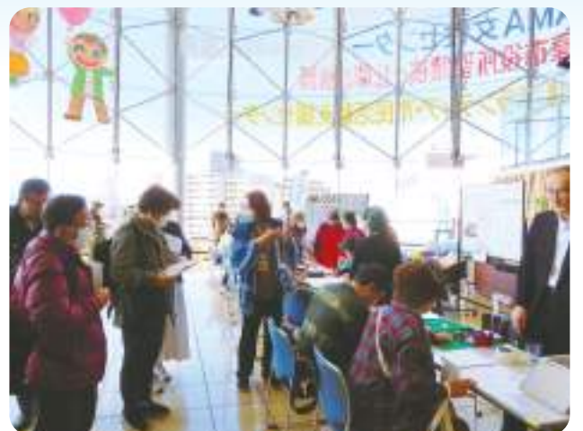
団体巡りツアーの様子

▶問合せ 多摩ボランティア・市民活動支援センター ☎(373) 6611 FAX (373) 6629