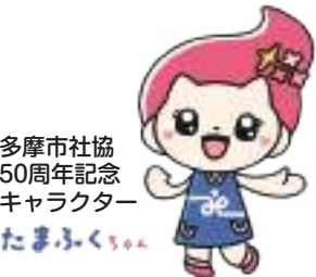
多摩市社協 50周年記念 キャラクター たまふくちゃん