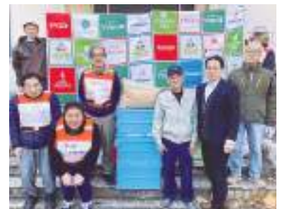
多摩市の生産者提供の精米を フードバンク団体へお届けしました

▶問合せ 多摩ボランティア・市民活動支援センター ☎(373) 6611 FAX(373) 6629