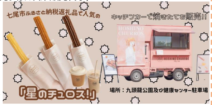
※画像は去年の内容となります。実際の内容とは異なる可能性があります。