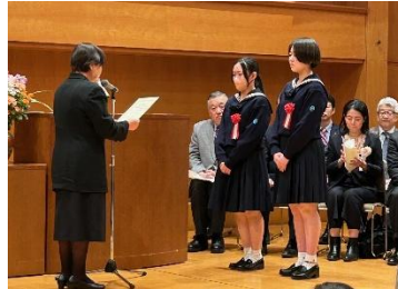
福祉大会当日の様子

第73回東京都社会福祉大会において、以下のボランティア登録団体が表彰されました。