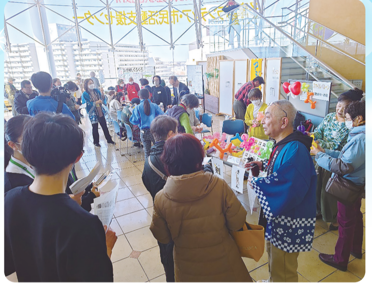
※写真は昨年の様子です。

お裁縫ボランティアの会/おもちゃ病院kebo/傾聴ボランティアグループ「福寿草」/この指とまれ/終活健幸サポート多摩/スマイルバルーン/たこの木クラブ/多摩市音訳グループ繭/多摩市視覚障害者福祉協会/多摩市手話サークル「クローバー」/多摩市点字サークル「トータス」/多摩市の保護猫の譲渡をすすめる会/小さな天使/伝統芸能たまいち座/「なかまの会」白楽荘グループ/南京玉すだれ多摩お江戸隊/にじいろの会/認定NPO法人日本セラピューテック・ケア協会東京支部/パソコン点訳サークルこがめ/パソコンボランティア多摩/ひなの会/ボランティアTAMA聞き書き隊/ボランティアサークル絵手紙くるくる/みんなであそぼう/リフォームおはりばこ（五十音順）