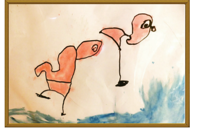
「みんなでみたフラミンゴ」 こぐま保育園 5才児