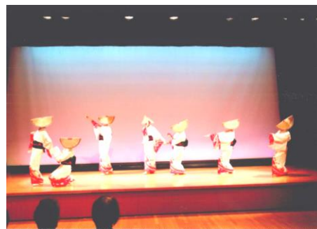
第40回多摩市民文化祭参加 越中おわら節踊り 於 ベルブホール 2017年10月29日(日)