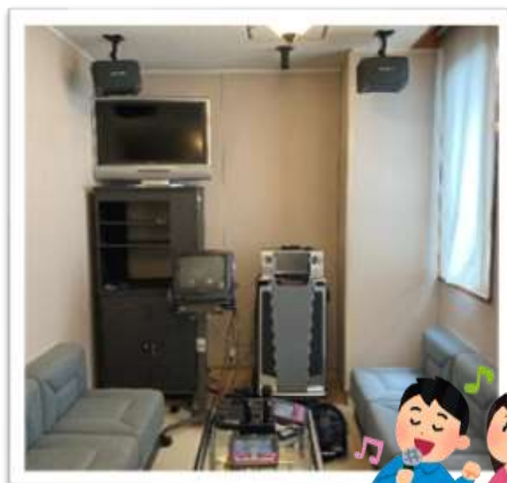
↑こちらが「音楽活動室」です♪