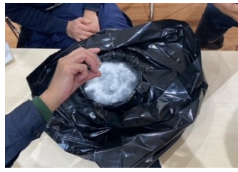
水が入ったトレイに凝固剤の粉を入れ、固まる様子を観察しました