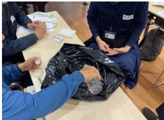
袋で覆ったトレイに水400mlを入れます