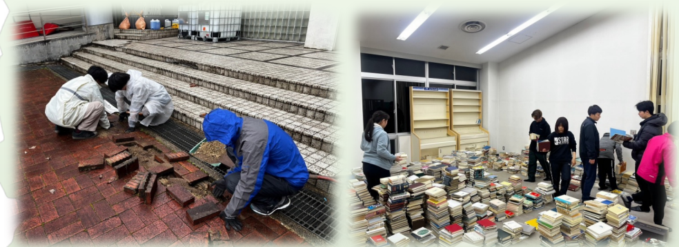
被災した学生・教職員のお力に少しでもなれるように