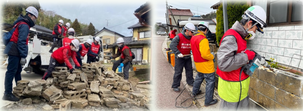
斜めになったブロック塀は被災者の心理的負担に