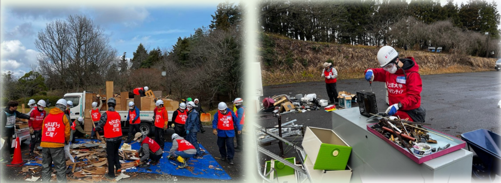
地震災害によって出た災害廃棄物を11種類に分別