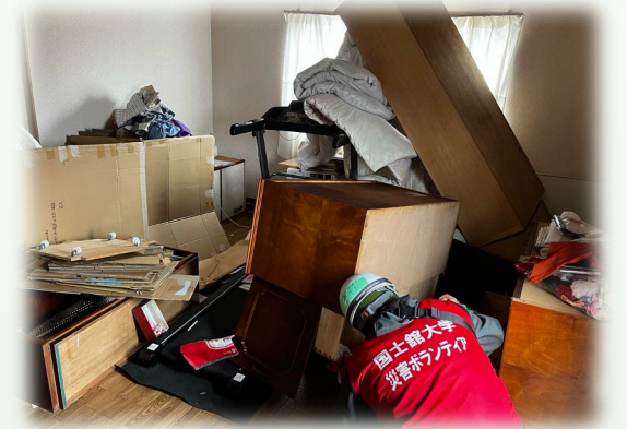
また住める日が来る事を信じて少しでも早く片付けを！