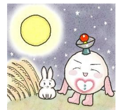
多摩市在住のイラストボラさんのタマボラ君です。