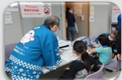
昨年度のボランティアパークの様子