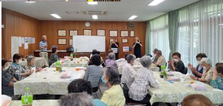
七夕食事会 7/6 桜ゆうゆう会共催