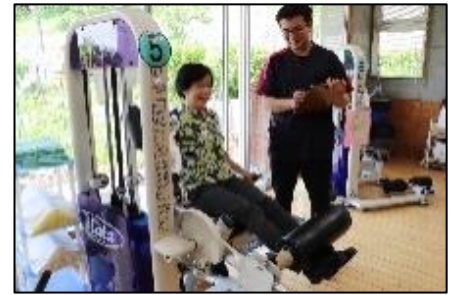
モデルのイメージです