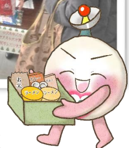
多摩市在住のイラストボラ 栗さんのタマボラ君です。

子ども・若者応援助成金は、多摩市内で生活困窮等により支援が必要な子ども及び若者を対象とする事業、団体等に対し、子ども・若者応援基金から助成金を交付することで、子ども・若者の健やかな成長を支える取り組みを推進し、地域共生社会の実現に寄与することを目的としています。詳しくは2面をご覧ください。