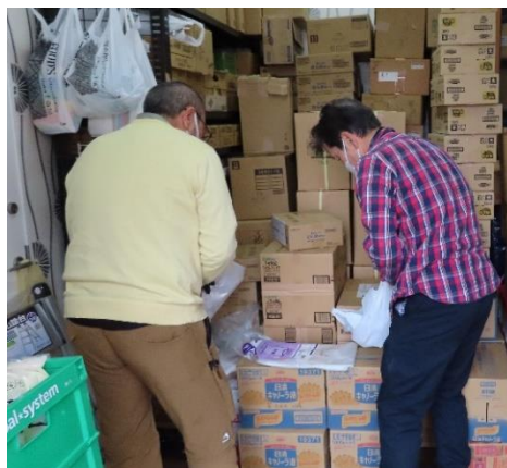
倉庫内に集まった食料を整理します