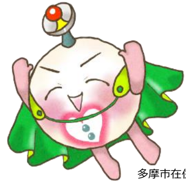
多摩市在住のイラストボラ雫さんのタマボラ君です。

6つの県庁所在地は見つかりましたか？ 正解者の中から抽選で下記の賞品をプレゼント！