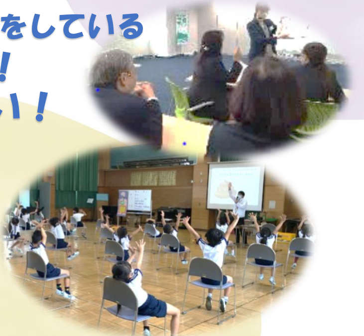
写真は講座のイメージです。実際の内容とは異なります。

多摩ボラセンでは、ボランティア活動団体や多摩地域で社会貢献活動をしている企業（ゆるたまネット会員）と連携して、ボランティア・地域活動をしているシニア層の方を対象に学習会を開催いたします。 講座内容、お申込み・お問合せ等については2面をご覧ください。