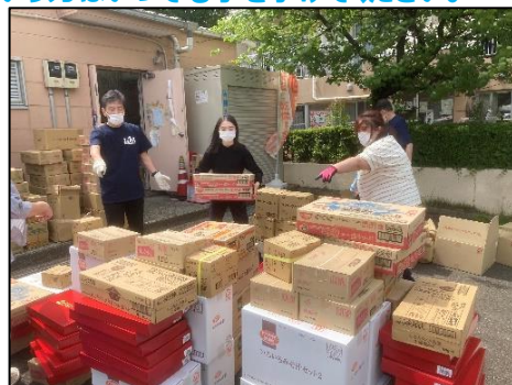
配送先ごとに仕分けを行います