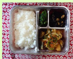
ある日のお弁当 2例