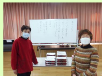
ふれんどスタッフ