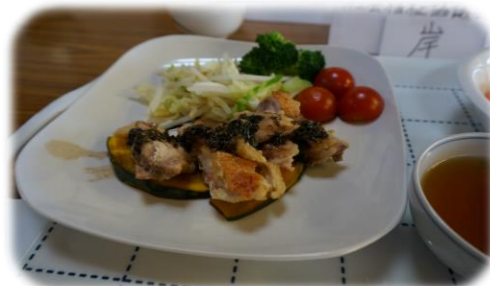
瓜生サロン(瓜生ランチ)