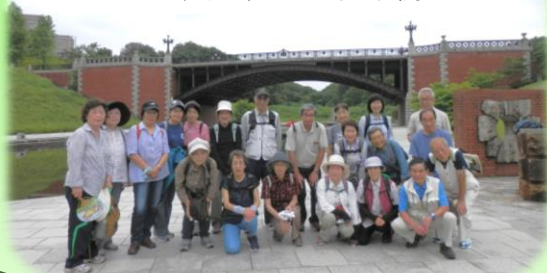
八王子市別所 長池見附橋

※まち歩き年会費 500円 (傷害保険代・写真代・資料代に充当) ※お弁当・水筒・タオル・交通費など持参