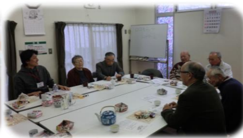
いきいきサロン・メゾネット永山