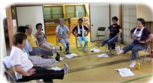
瓜生元気アップトレーニング