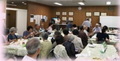
食後は歌を楽しみました♪