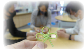
あなたも作ってみませんか?