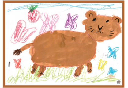
「らいおん」 こばと第一保育園 5才児