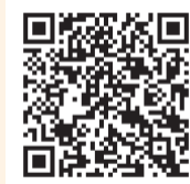
ご近所支えあい ハンドブック