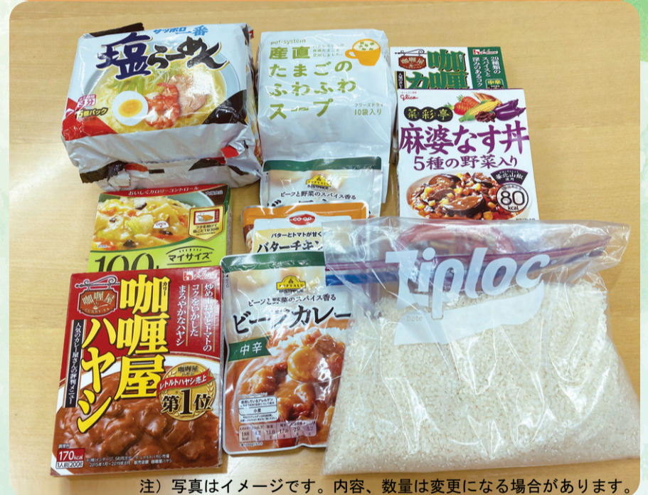
注) 写真はイメージです。内容、数量は変更になる場合があります。

米、レトルト食品、インスタントラーメン等の数日分詰め合わせキット(持ち帰り用のエコバッグ等を持参ください。)