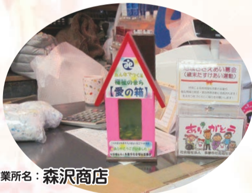
事業所名：森沢商店