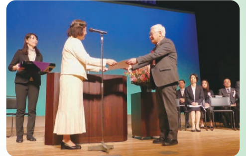
写真は前回の大会