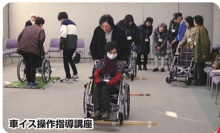
車イス操作指導講座