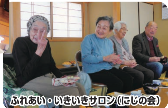
ふれあい・いきいきサロン(にじの会)

ボランティア活動など 【ボランティア・市民活動推進事業】 ● 災害ボランティアセンター設置 ● ボランティア講座