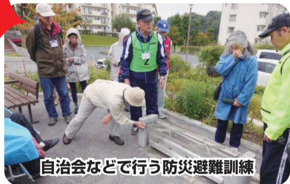
自治会などで行う防災避難訓練