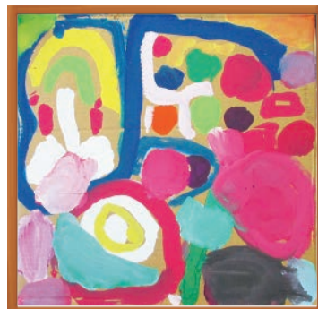
「絵の具でお絵かき楽しいな」 ハオハブ保育園 4歳児

発行：社会福祉法人多摩市社会福祉協議会 〒206-0032 多摩市南野3-15-1 ☎ 042(373)5611 FAX 042(373)5612 http://www.tamashakyo.jp/