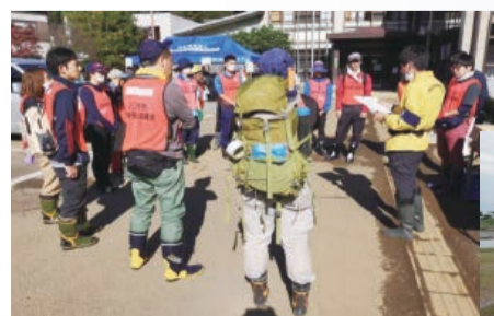
◀八王子市災害ボラセン(浅川サテライト)オリエンテーション

災害ボラセンの支部のこと。本部と同様の機能を、被災地の近くに設置することで、住民のニーズ聞き取りや、災害ボランティアの活動調整を効率的に支援します。