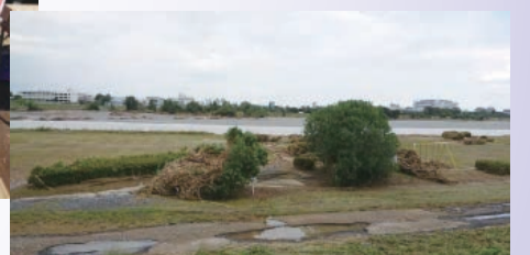
台風19号後の多摩川▶