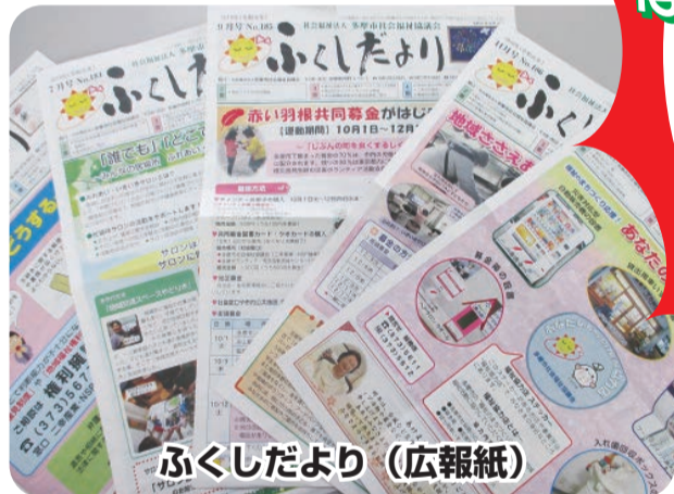
ふくしだより(広報紙)

ボランティア活動など 【ボランティア・市民活動推進事業】 ● 災害ボランティアセンター設置 ● ボランティア講座