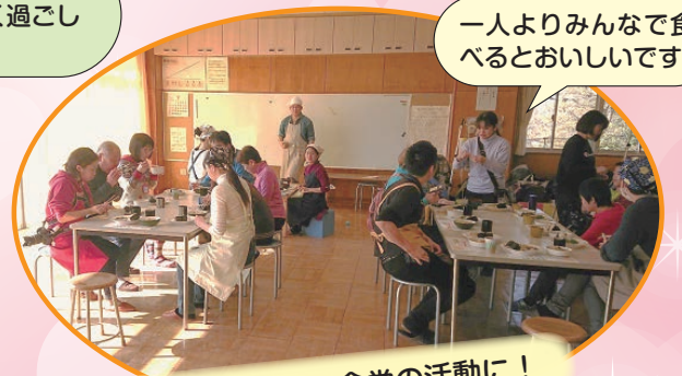
一人よりみんなで食べるとおいしいです。