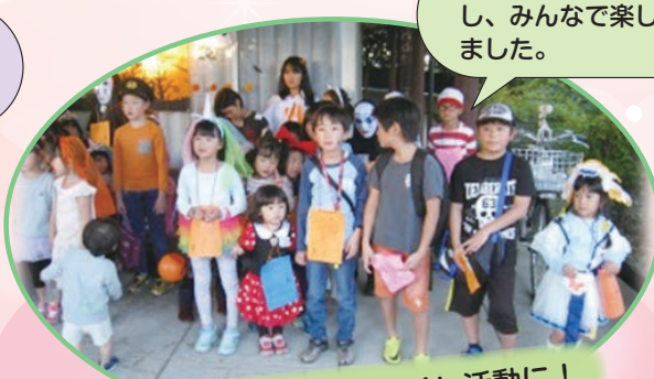
自治会でイベントを開催し、みんなで楽しく過ごしました。