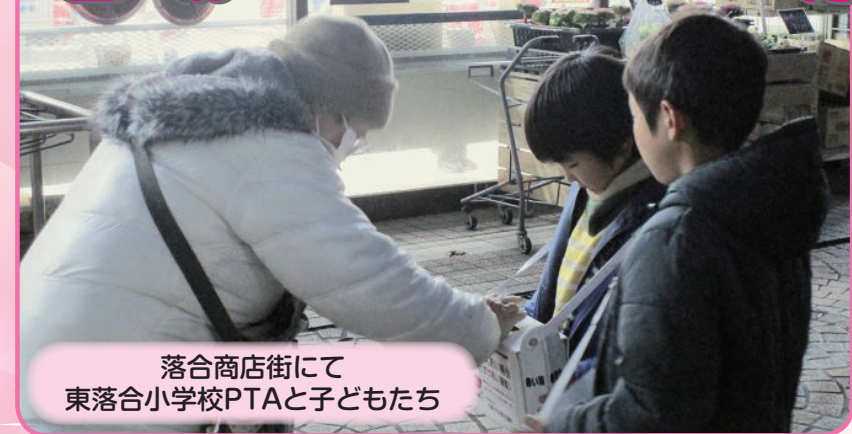
落合商店街にて 東落合小学校PTAと子どもたち