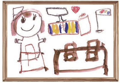
「交通公園で遊んだよ」 桜ヶ丘第一保育園 5才児

発行：社会福祉法人多摩市社会福祉協議会 〒206-0032 多摩市南野3-15-1 ☎ 042(373)5611 FAX 042(373)5612 http://www.tamashakyo.jp/