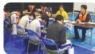
ボランティア受付の様子

浅川・恩方の地区で土砂崩れや床下浸水などの被害を受けたことから、職員を派遣し、災害VCの立ち上げより協力しました。立ち上げ後も、ボランティアだけでなく、11月4日まで職員を交代で派遣し、ボランティア受付やニーズ調査、マッチングなど災害VCの運営に協力しました。