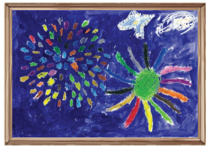
「花火」 みどりの保育園 5才児

発行：社会福祉法人多摩市社会福祉協議会 〒206-0032 多摩市南野3-15-1 ☎ 042(373)5611 FAX 042(373)5612 http://www.tamashakyo.jp/