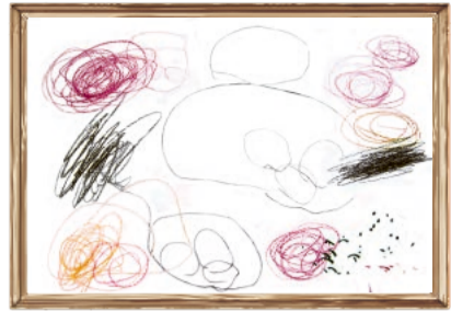
「ぐるぐるだいすき」 どんぐり保育室 2才児

発行：社会福祉法人多摩市社会福祉協議会 〒206-0032 多摩市南野3-15-1 ☎ 042(373)5611 FAX 042(373)5612 http://www.tamashakyo.jp/