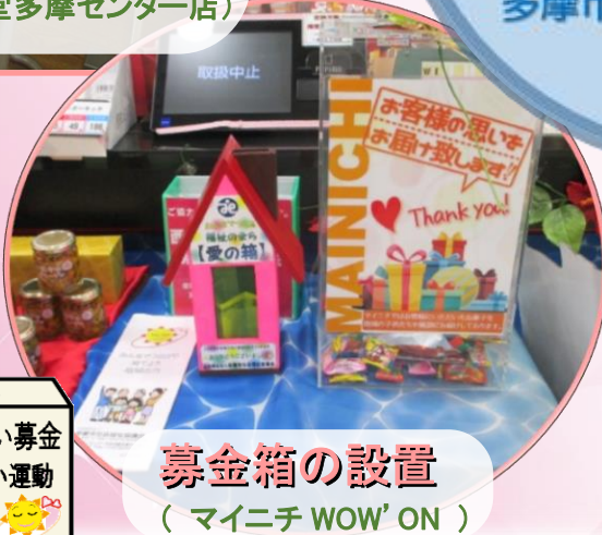
地域ささえあい募金 歳末たすけあい運動

このシールがあるお店や事業所は、「福祉協力店」で、皆さまの身近なところにあります。 福祉協力店とは・・・ 多摩市の「福祉のまちづくり」を支え、地域福祉活動に協力して下さる商店や企業などです。福祉協力店になって「福祉のまちづくり」にご協力をお願いします。 (福祉協力店一覧は2面へ)