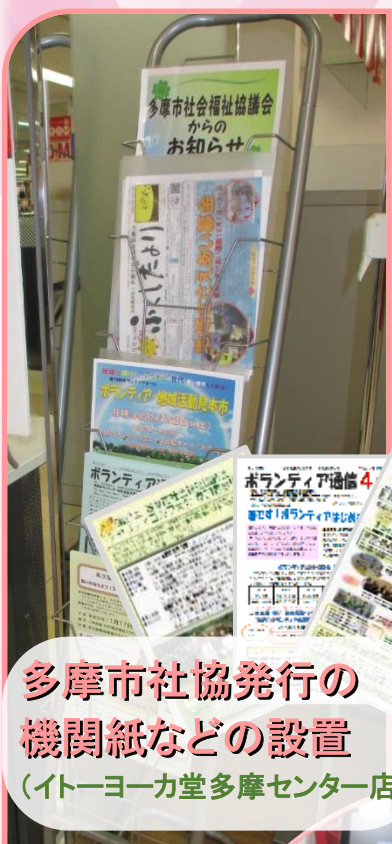
多摩市社協発行の 機関紙などの設置 (イトーヨーカ堂多摩センター店)