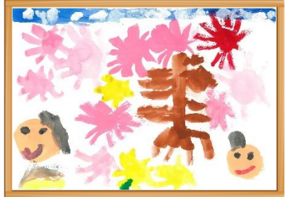
『ひなまつり』 りすのき保育園 5才園児

発行：社会福祉法人多摩市社会福祉協議会 〒206-0032 多摩市南野 3-15-1 ☎ 042(373)5611 FAX 042(373)5612 ① http://www.tamashakyo.jp/