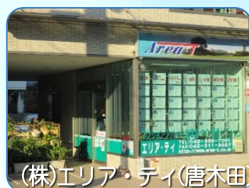
(株)エリア・ティ(唐木田)