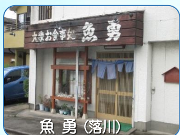
魚 勇 (落川)