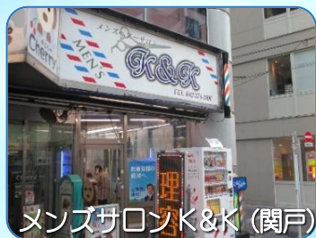
メンズサロンK&K (関戸)