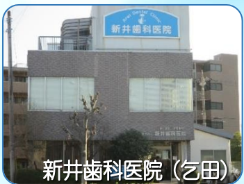
新井歯科医院 (乞田)