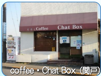
coffee・Chat Box (関戸)

今回は新たな取り組みである、赤い羽根共同募金・地域ささえあい募金（歳末たすけあい運動）の災害時対応型自動販売機を設置いただいた福祉協力店7店舗を紹介！！ ※福祉協力店の一覧表は2面をご覧ください。