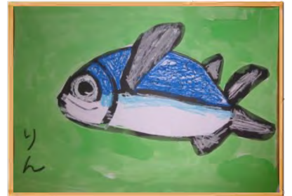
『さかな』 (あおぞら保育園・5才・女の子) の作品

社会福祉法人 発行：多摩市社会福祉協議会 〒206-0032 多摩市南野3-15-1 ☎ 042(373)5611(代表) FAX 042(373)5612 HP http://www.tamashakyo.jp/