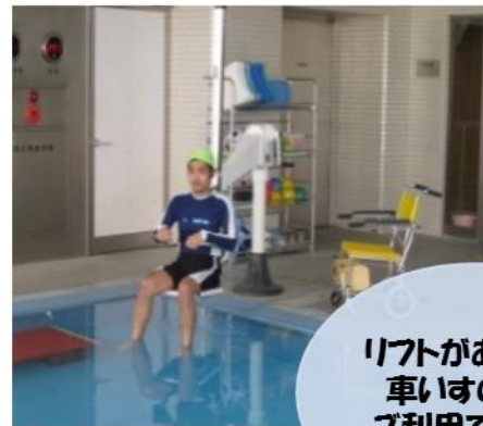
リフトがあるので 車いすの方も ご利用できます