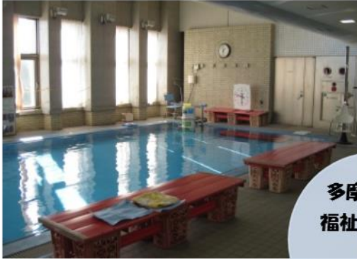
多摩市総合 福祉センター 5階 水浴訓練室

広さ：12×5m 水深：0.9～0.95m（腰までの高さ） 水温：33～36℃ （温水なので冬でも大丈夫です！）