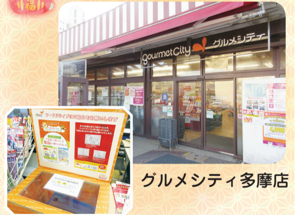
グルメシティ多摩店