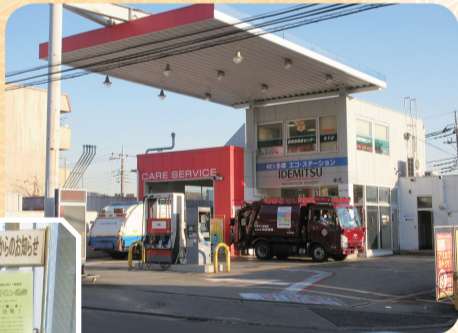
多摩興運(株) 多摩エコ・ステーション