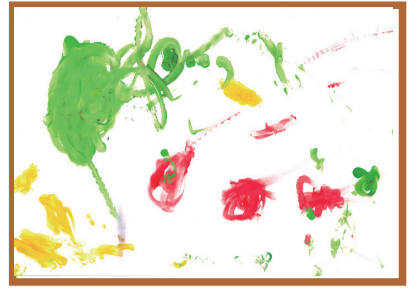
「ばすとかぞく」 どんぐり保育室（2才児）