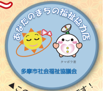
このシールが目印です！

福祉協力店とは、「だれもが安心して暮らせる福祉のまちづくり」に向け、多摩市社協が行う活動を支援している事業所や商店、企業です。皆さまの身近な地域で様々な取り組みを通じて協力していただいています。ぜひお立ち寄りください。（協力店の一覧、協力内容は2面で紹介しています）