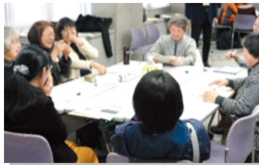
▲好評のサロン交流会。参加者同士の情報交換が活発に行われています