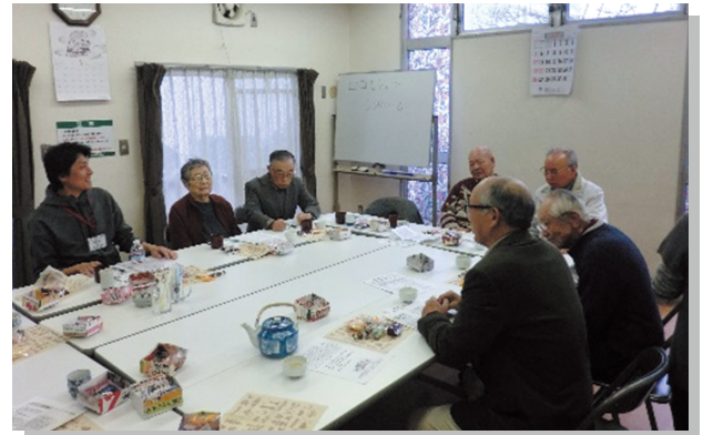
▲男性中心のサロンでは茶話会の他 囲碁や将棋、健康マージャンも

どんな活動か体験してみたい、という方は「出前サロン」をお試しください。社協コーディネーターがみなさまの所へお伺いし、一緒に活動を行います。