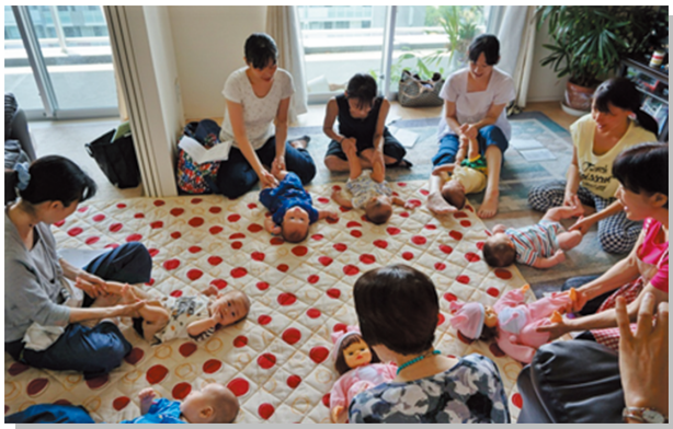
▲サロンでベビーマッサージ 先輩ママに教わって

「ふれあい・いきいきサロン」は、高齢者や子育て中の親子など、誰もが気軽に立ち寄れる地域の仲間づくりと出会いの場です。多摩市では、110団体を超えるサロンが活動しています。お茶飲みやおしゃべりを通して顔見知りが増え、地域の“見守り”や“閉じこもり防止”にもつながります。